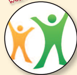
Gemeinde der Heiligung

„Die Gemeinde Gottes ist eine Freikirche entschiedenen Christentums. Sie hat den Auftrag, das Evangelium zu verkündigen und Menschen zur Entscheidung für Christus zu rufen. Sie lehrt die Nachfolger Jesu, gemäß der Bibel zu leben und zu handeln. Es gehört zu ihrer Aufgabe, Gemeinden nach dem neutestamentlichen Vorbild zu gründen und zu bauen.“