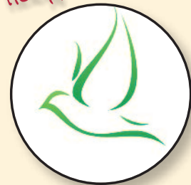
Gemeinde des Geistes